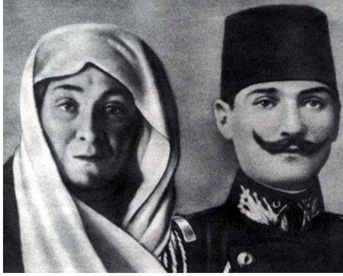
Ali Rıza Efendi ve Zübeyde Hanım

O günden sonra Mustafa, hayatının her döneminde “ Kemal ” adıyla anıldı — bu isim, onun yetenek ve vizyonunun bir göstergesiydi.